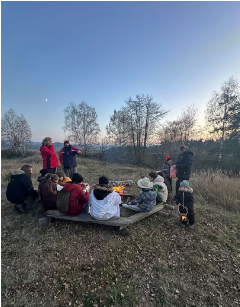
Lampionový průvod s ohněm v lomu