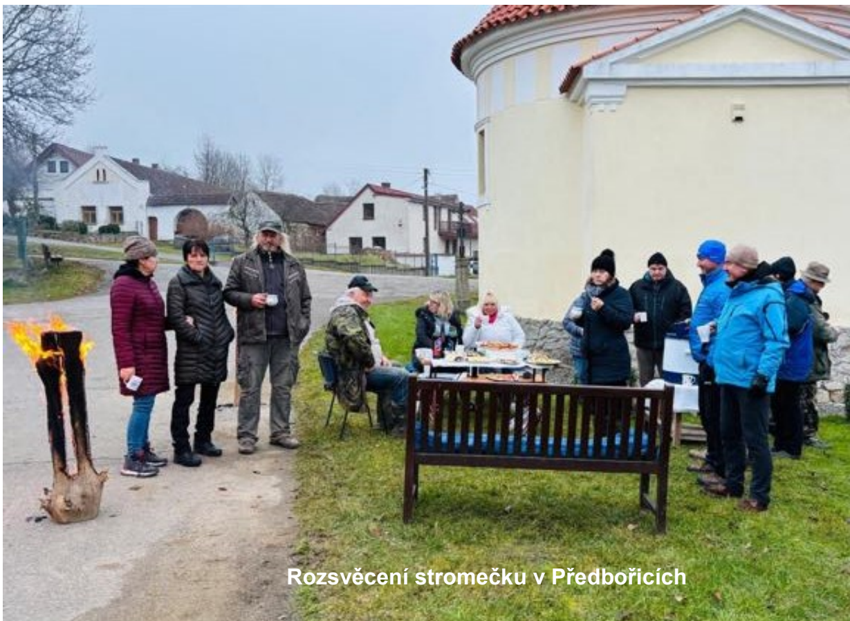
Rozsvěcení stromečku v Předbořicích