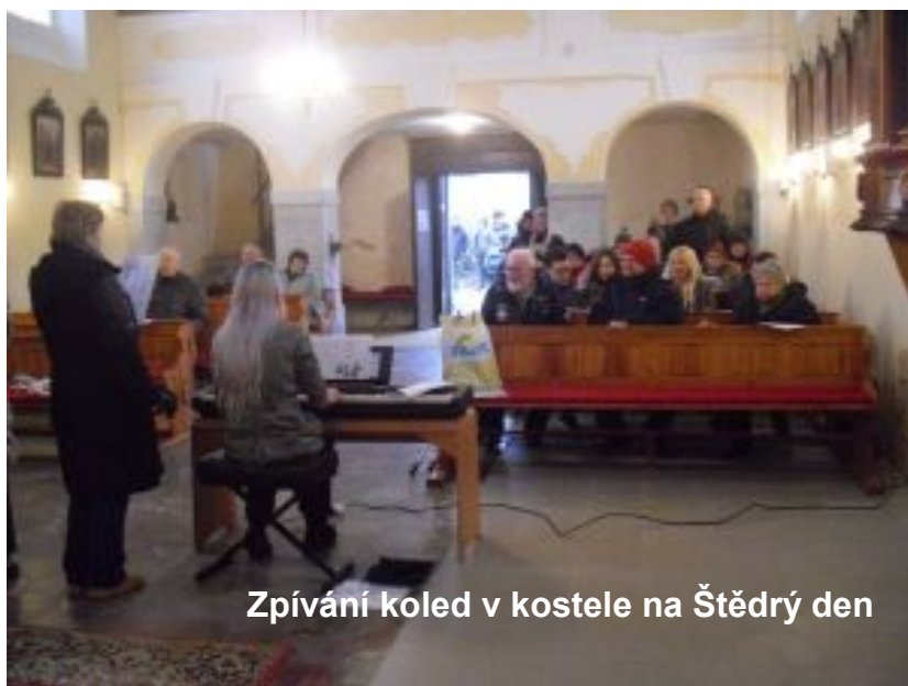
Zpívání koled v kostele na Štědrý den

Přejeme Vám hodně zdraví a štěstí do roku 2025