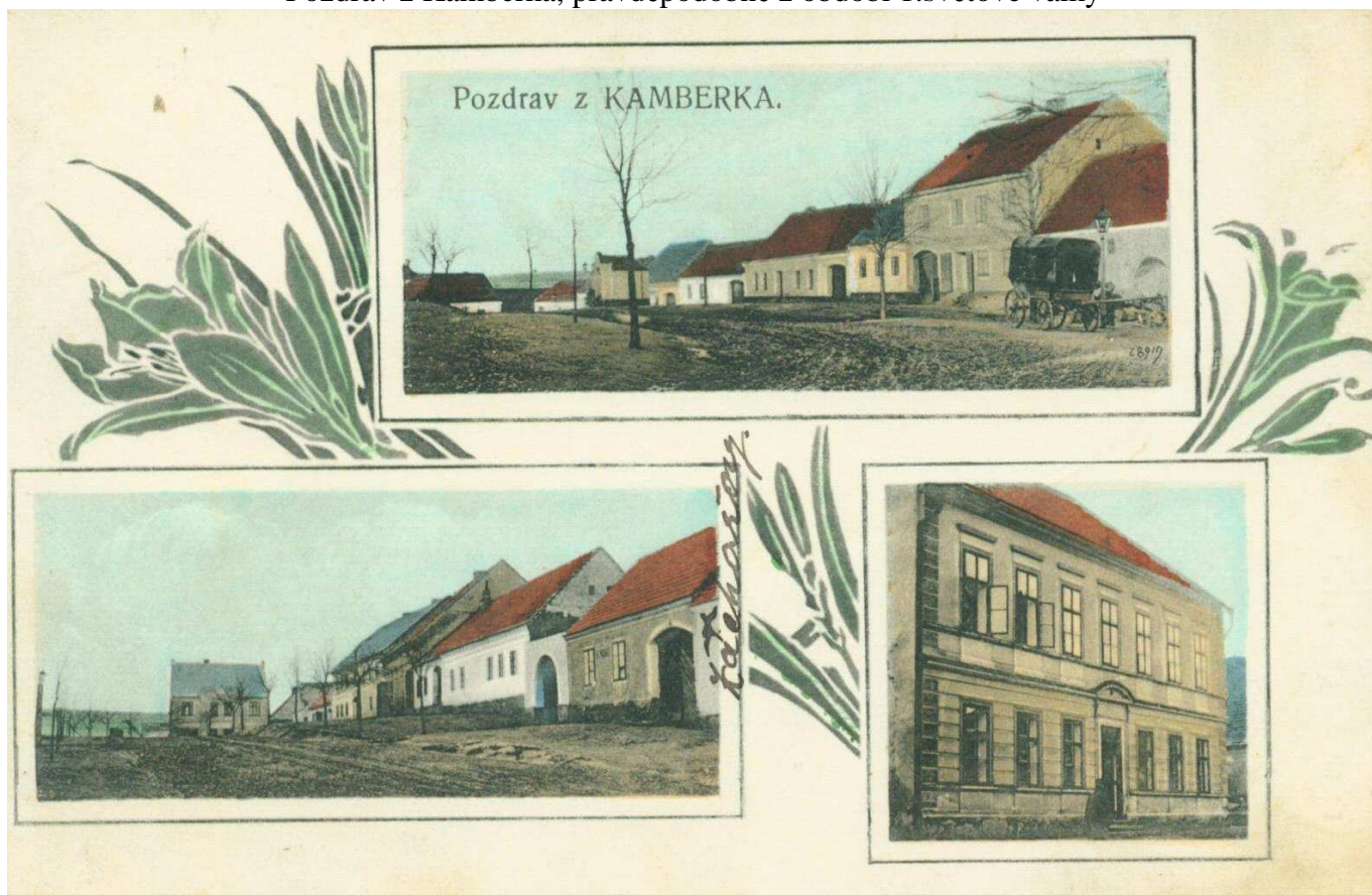
Pozdrav z Kamberka, pravděpodobně z období 1.světové války